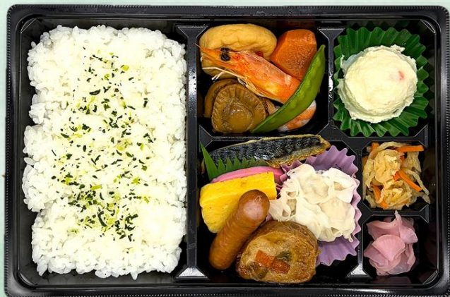
幕の内 1,296円 (税込)