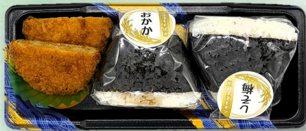
おにぎり弁当 756円（税込）