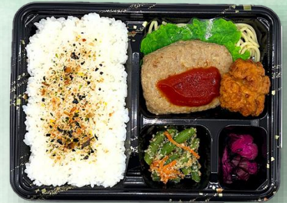
ハンバーグ弁当 850円（税込）