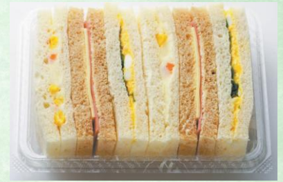
手数料対象外 ミックスサンド 580円（税込）