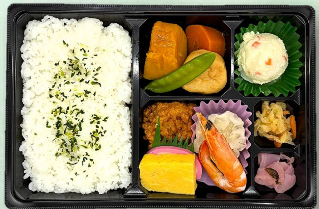
幕の内 1,080円 (税込)