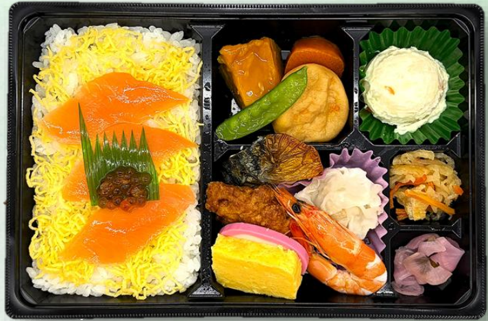
海鮮幕の内 1,404円 (税込)