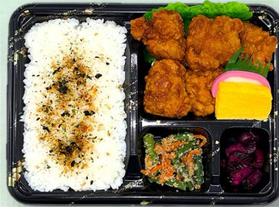
鶏唐揚げ弁当 950円（税込）