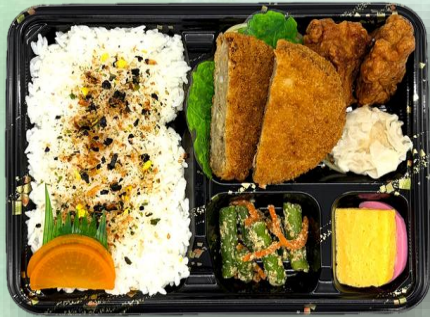
お好み弁当 972円（税込）

研修旅行、スポーツ大会などイベント向けボリュームお弁当です。 軽食（おにぎり、サンドイッチ）もご用意しております。