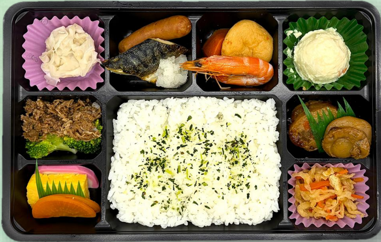
幕の内 1,620円 (税込)

※季節、仕入れ状況により、内容の一部が変更となる場合があります。あらかじめご了承ください。