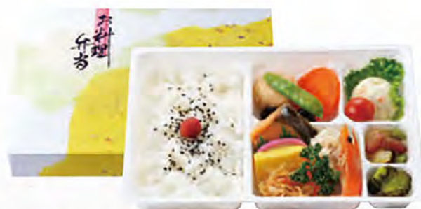
幕の内 小売価格(税込) ¥972