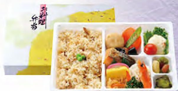
幕の内 小売価格(税込) ¥1,080