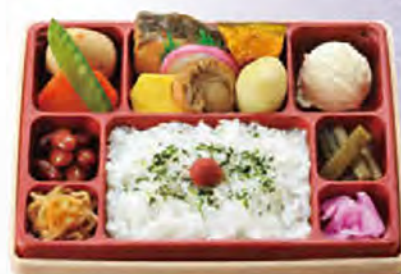
幕の内 小売価格(税込) ¥864