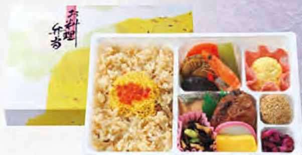
幕の内 小売価格(税込) ¥1,188