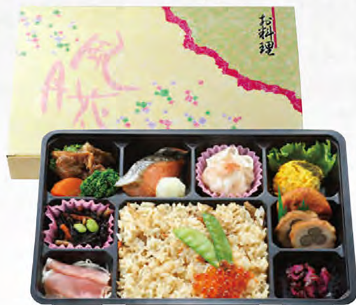
幕の内 小売価格(税込)¥1,728