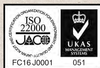
札幌バルナバフーズ株式会社 空弁水産事業本部