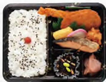
幕の内 小売価格(税込) ¥756