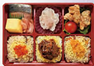
幕の内 彩 小売価格(税込) ¥1,150