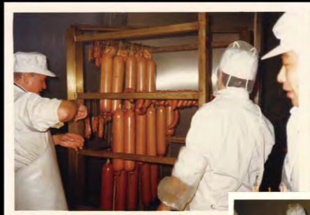
創業当時にドイツからマイスターを迎え技術指導を受けた当時の様子